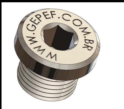
BJSIA - Bujão em aço com sextavado interno

Disponíveis para todos os tipos de rosca e diâmetros de tubos, em aço inox ou aço carbono.